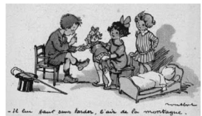
- 16 ans pour avoir l'air de la montagne.