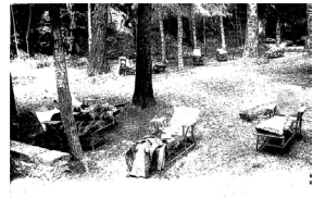
(CHAM MULLER) - 1923 env. Le par de la cure d'été sous le ciel.

La station balnéo-climatique des Escaldes, "Grand Etablissement Thermal des Escaldes" Publié par le "Congrès Français" de la Société de Climatisme, 1925