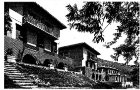
Sanatorium des Escaldes - Les villa Miralles, La Solana et Ripoll conçus par l'architecte Henri Martin en 1917, dessin de la Grand Union de Barcelone.

"Les avantages climatiques que présente cette région de Cerdagne sont connus...Sa siccité, sa luminosité, l'abondance totale de bruyants, l'intensité de soleil en toutes saisons et surtout dans la période d'hiver, l'absence de changements brusques de température ou de pression barométrique devaient nécessairement appeler l'attention des Médecins sur l'intérêt qu'il y a à utiliser les malades atteints d'affections pulmonaires..."